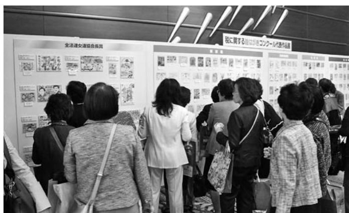
税に関する絵はがきコンクール優秀作品の展示