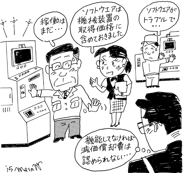
イラスト 渡辺 正義